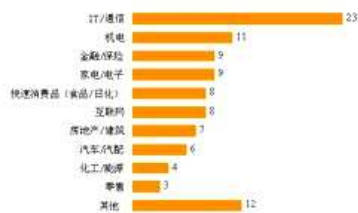
最佳人力资源典范企业员工规模