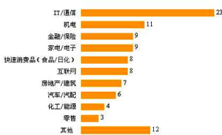
前程无忧公布2009中国最佳100家人力资源典范企业